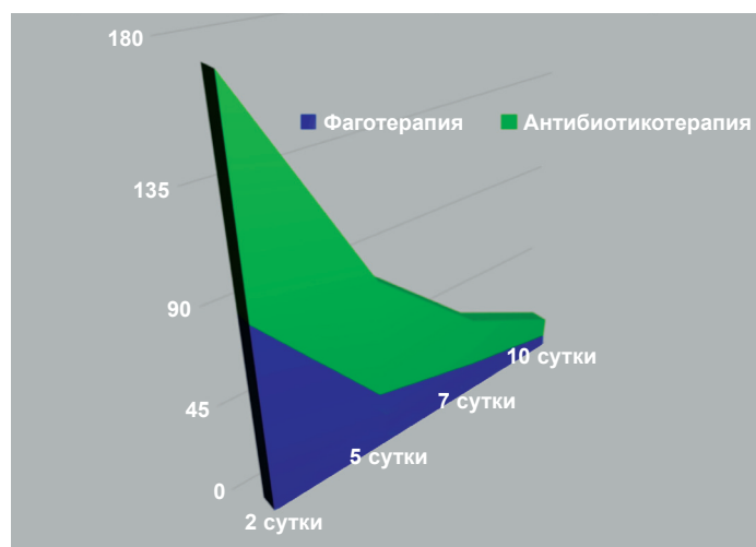
Рис. 3. Сравнительные данные риноманометрии.